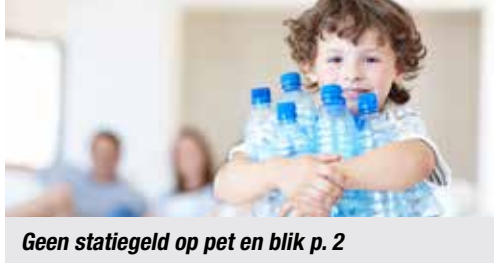
Geen statiegeld op pet en blik p. 2