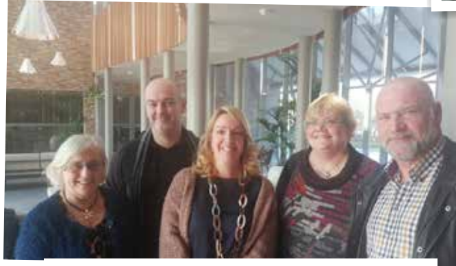
N-VA mee op studiedag in WZC Sint-Jozef.