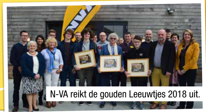
N-VA reikt de gouden Leeuwjes 2018 uit.