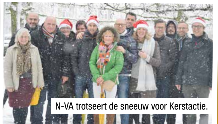
N-VA trotseert de sneeuw voor Kerstactie.