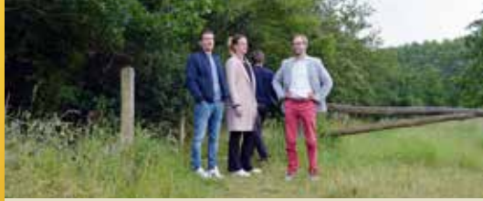
Uniek wandelen in de Warandeputten (p. 2)