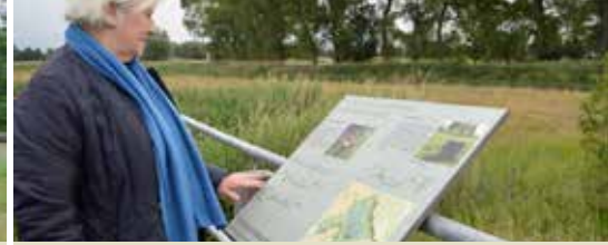
Uitkijkplatform aan overstromingsgebied Baliebrugge (p. 3)