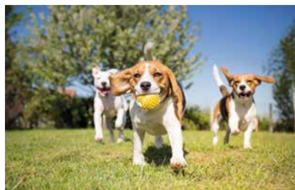
▲ Er komt binnenkort een eerste hondenloopweide in de gemeente. Hier ijverde de N-VA al een tijdje voor.