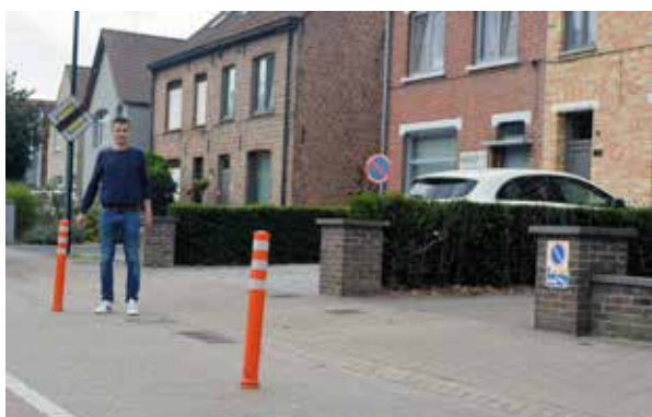
▲ Het parkeerprobleem in de Kortrijksestraat wordt aangepakt, na herhaaldelijke vragen hierover door de N-VA.