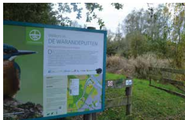
▲ De broodnodige werken aan de Warandeputten staan na aandringen van de N-VA eindelijk op de agenda.